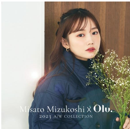
【水越みさと×Olu.】メインイメージ

また10月17日(火)より、20~30代の女性を中心に人気の美容クリエイター“水越みさと(みずこしみさと)”“さんとのコラボレーション【水越みさと×Olu.】も発売開始。この秋冬のおでかけに活躍するワンピース、マーメイドスカート、ニットトップス、セットアップの全4型をご用意しており、マーメイドスカートとニットトップスはPOP UP 限定カラーも発売いたします。