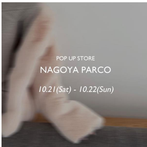
「Olu. POPUP STORE NAGOYA PARCO」メインイメージ

フリー株式会社の子会社であるオールドット株式会社(本社:東京都渋谷区、代表取締役社長:稲垣涼子、以下 Olu.)は、ライフスタイルブランド『Olu.(オールドット)』につきまして、10月21日(土)~10月22日(日)名古屋 PARCO(愛知県名古屋市)、翌週10月28日(土)~10月29日(日)MIL 2ND(東京都渋谷区)にて期間限定で POP UP STORE を開催いたします。