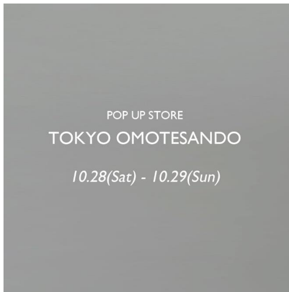
「Olu. POPUP STORE TOKYO OMOTESANDO」メインイメージ

また10月17日(火)より、20~30代の女性を中心に人気の美容クリエイター“水越みさと(みずこしみさと)”“さんとのコラボレーション【水越みさと×Olu.】も発売開始。この秋冬のおでかけに活躍するワンピース、マーメイドスカート、ニットトップス、セットアップの全4型をご用意しており、マーメイドスカートとニットトップスはPOP UP 限定カラーも発売いたします。