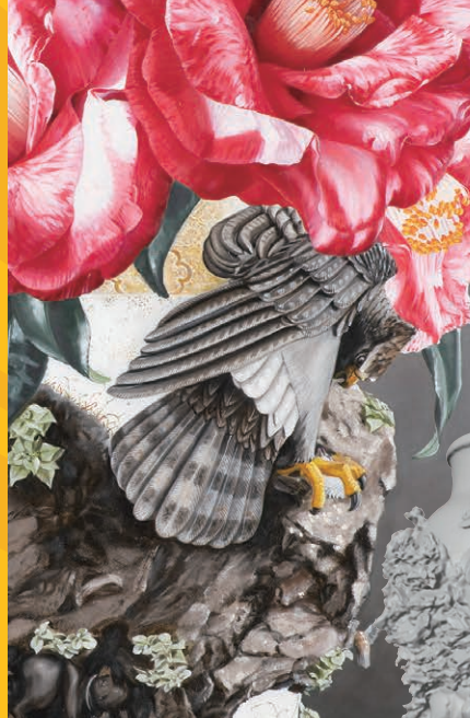
渡辺香奈〈一輪を花束にして〉(部分)

当館が所蔵する最大級の眞葛焼「崖ニ鷹大花瓶」の原寸大(約52cm) 3Dプリントを展示。その大きさのため、無彩色の3Dレプリカですが見応えのある迫力!