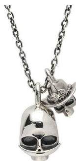
□スカルネックレス 白ひげ&エース