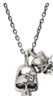
□スカルネックレス ドラゴン&サボ