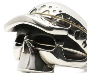
□スカルリング ロー