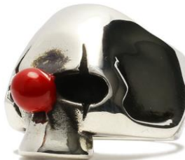
□スカルリング バギー