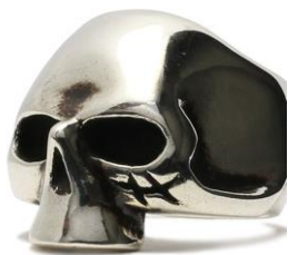
□ スカルリング ルフィ

スカルリング 4種類、スカルネックレス 3種類、スカルピアス 5種類、スカルブレスレット 1種類