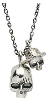
□スカルネックレス シャンクス&ルフィ