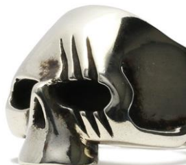
□スカルリング シャンクス