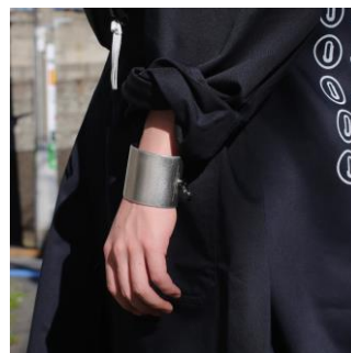
バイブレーション (XL)