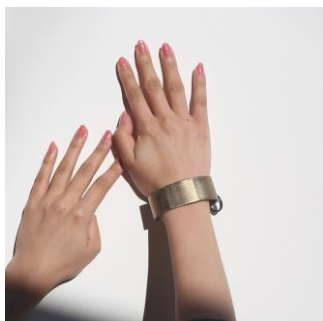
ファイヤーゴールド (M)