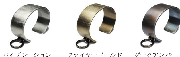
バイブレーション