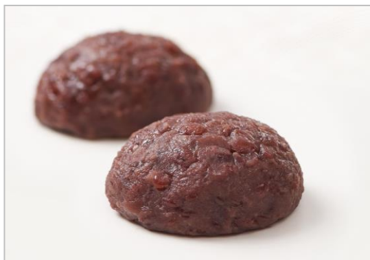
『おはぎ（つぶ）』（税込162円／1個）