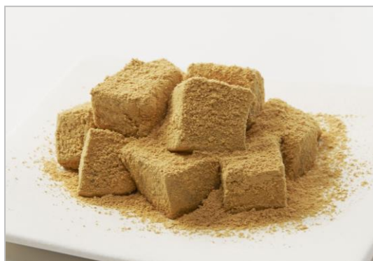
『料亭わらび餅』 (税込302円／1パック<小>)