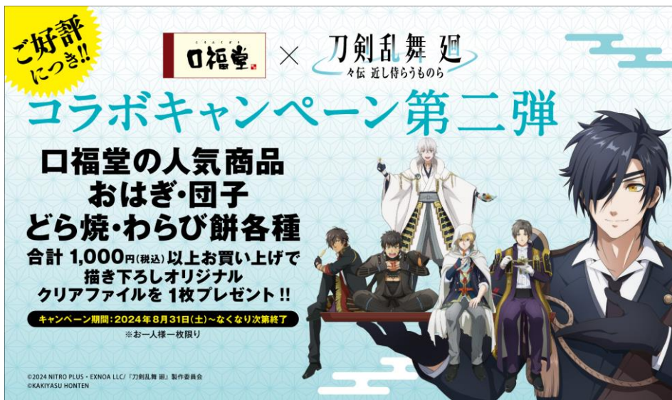
口福堂×『刀剣乱舞 廻 -々伝 近し侍らうものら-』 “描き下ろしオリジナルクリアファイル”のコラボビジュアル

今回は、口福堂の人気商品を1,000円(税込)以上ご購入で、描き下ろしオリジナルクリアファイル(A4サイズ)を一枚プレゼント。2024年8月31日(土)から一部店舗を除く口福堂150店舗で実施いたします。なくなり次第終了となりますので、ぜひお早めにお買い求めください。