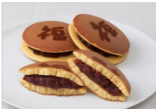
『伊勢の響どら焼』（税込162円／1個）