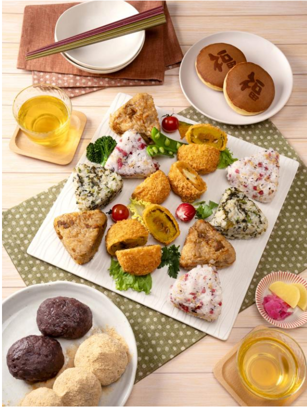
柿次郎 商品イメージ