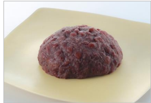
『おはぎ(つぶ)』 (税込 183 円/1 個)