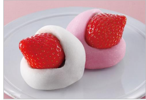
<右>『いちご大福(つぶあん)』 <左>『いちご大福(こしあん)』 (税込 432 円/各 1 個)