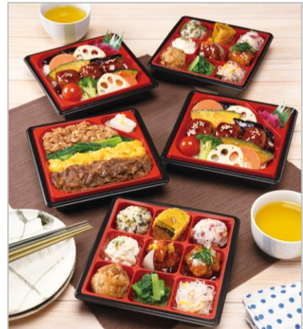
和菓子に加え惣菜や弁当も充実