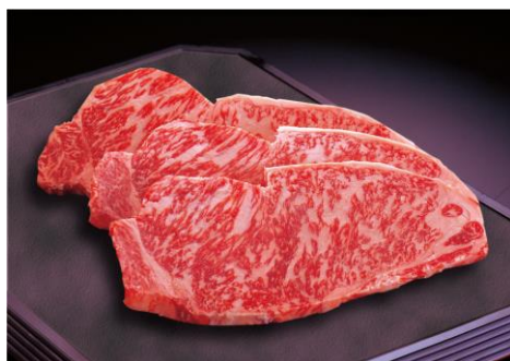
『黒毛和牛（国内産）サーロインステーキ』