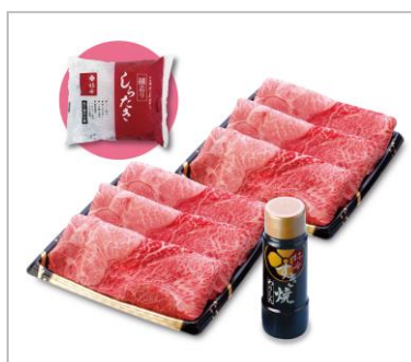
オープン記念感謝袋イメージ