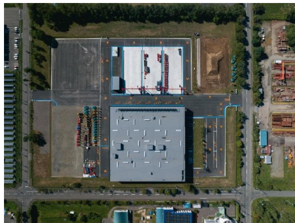
千歳テクノパーク統括工場、全景