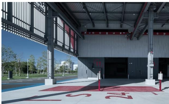
アウターキャノピー(大庇)