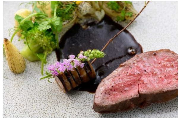
レストラン「FLYING HOG GRILL」コースメニュー一例

■ 営業時間：ランチ 11:30-14:00（最終入店 13:00） / デイナー 18:00-22:00（最終入店 21:00）