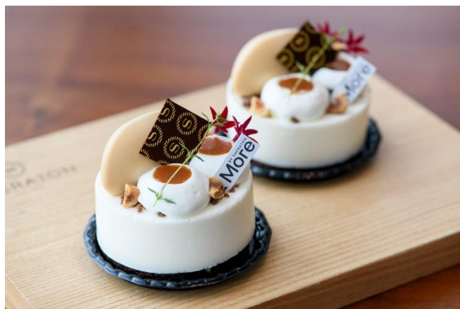
『天然あま塩とキャラメルのアラチーズ』

カフェ「&More by Sheraton」では、深まる秋を思わせるキャラメルのお菓子に天然あま塩のしょっぱさがアクセントになった『天然あま塩とキャラメルのアラチーズ』や、自然豊かな地で育てられた『日置野菜のピザ』などを販売します。