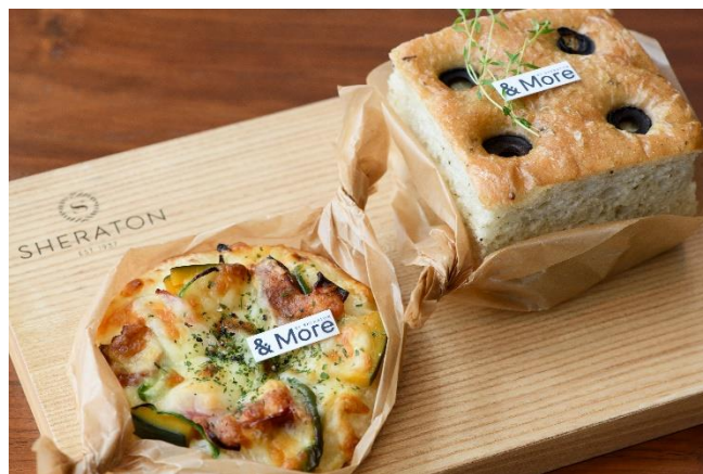
『日置野菜のピザ』(写真左)