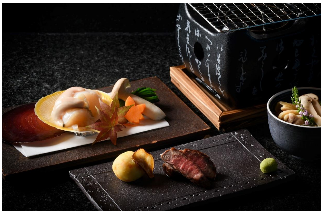
居酒屋「さつまぐま」で提供する『日置産 月日貝の七輪焼き』、『日置産 黒毛和牛の炙り焼き』