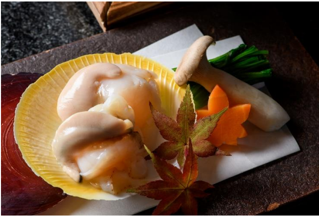
『日置産 月日貝の七輪焼き』

鹿児島の食の魅力や地元の名酒と堪能できる居酒屋「さつまぐま」では、なめらかな口当たりで、甘く濃厚な味わいや旨みの特徴の“月日貝”を七輪焼きにて提供する『日置産 月日貝の七輪焼き』や、鹿児島県民には秋の風物詩として「秋太郎」の愛称で親しまれているバショウカジキのお造りなど、旬の日置食材をおまかせコースやアラカルトにて提供します。