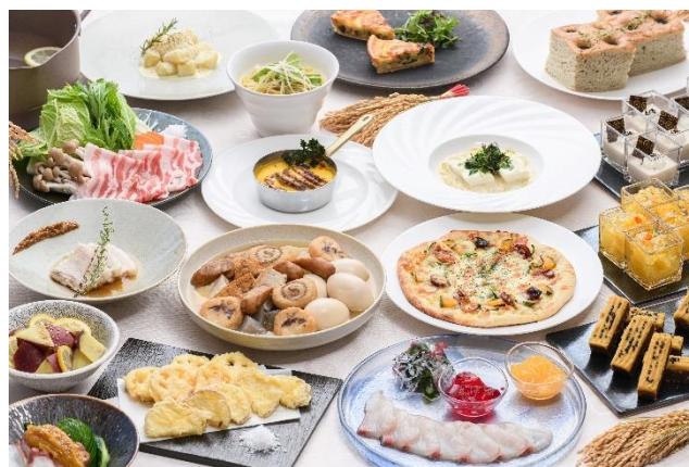
レストラン「Daily Social」buffetメニュー例