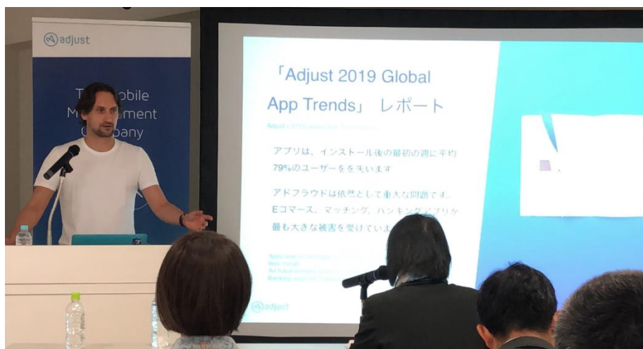
ポール H. ミュラー

また、2018年に最も成長したのはミッドコアゲームで、スポーツゲームや、ライドシェア・タクシー配車アプリも急成長を遂げたことが分かりました。また、全体として、インストール日からインストール後1日目までに、アプリの全ユーザーの平均69%が失われることが明らかになりました。日本において最も成長しているカテゴリーは音楽、カジノおよびミッドコアゲーム、ライドシェア・タクシー配車アプリであり、使用状況においてはゲーム（ミッドコア・カジュアル・スポーツ）が一日のアプリ内使用時間の50%近くを占めていることが明らかとなりました。」