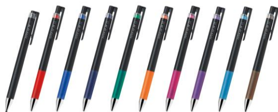
細書きながらなめらかな書き心地の 水性顔料ゲルインキボールペン「ジュースアップ」