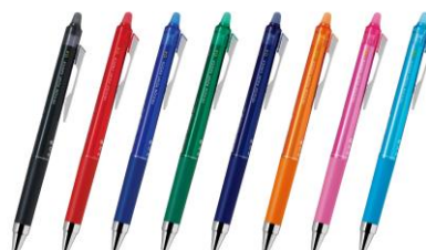
こすると消えるボールペン 「フリクションポイントノック 04」