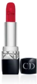
ルージュ ディオール (限定2色) 価格： 4,212 円 (税込)