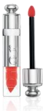
ディオール アディクト フルイド スティック (限定1色/ 551 ロマンズ) 価格： 4,212 円 (税込)