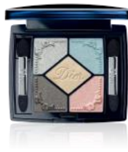
サンク クルール <トリアノン エディション> (限定1色/ 234 パステル フォンタンジュ) 価格： 8,316 円 (税込)