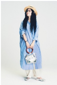
yukiさん @yuki_takahashi0706 Instagram フォロワー 7.8 万人

本当に自分が好きなものを共有して、その誰かの好きなものを信じて買う事ができる、今までありそうでなかったサービス！ ぜひ、これからトレンドになっていくこのサービス、今のうちに要チェックです！