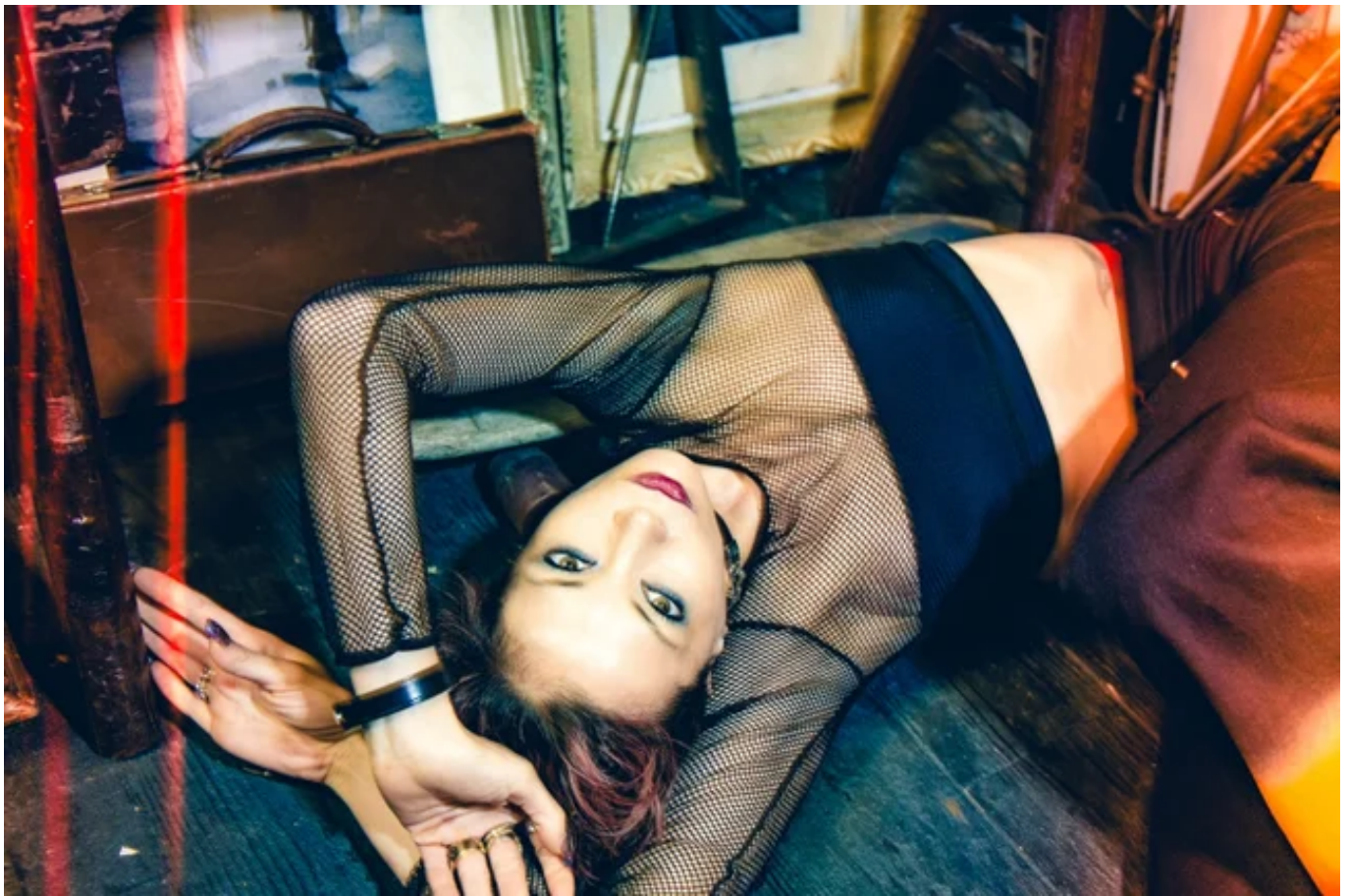
Anna Tsuchiya 2

「この節目にバンドを結成したことは、日本に限らず海外でも、自分たちがかっこいいと思う音楽を胸を張ってやり続けて、死ぬまで歌っていきたいという意思表示。いろんな音楽がこの世の中転がってると思うけど、人の心を震わせる様な威力が、ロックには生きてると思っている。自分はそれが好きで、たくさん救われてきた。だからみんなにもそれを届けたい。笑いたい人、泣きたい人、辛いと思ってる人、元気出したい人、いろんな感情が生きているとあるけど、人間の生々しい感情を綺麗だなんて思う人は、ぜひリアルなロックを聴きにきて欲しい。音楽で一つになる感覚をたくさんの人に届けたいと思います。」