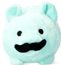
右) ぬいぐるみ (ヒゲアニマル) 990円