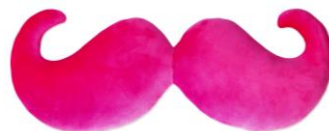
ピンクが鮮やか！ふわふわクッションとぴかぴかランプ