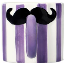
ひげがついているみたい にみえるマグ マグ (ひげ) 880円