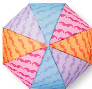
日本上陸当時はビニール傘。 それが折り畳みになって登場！ 折り畳み傘 1,045円

2012年の日本上陸当時から「フライングタイガー＝ひげ」と認識されるほどの定番モチーフがカラフルに復活です。