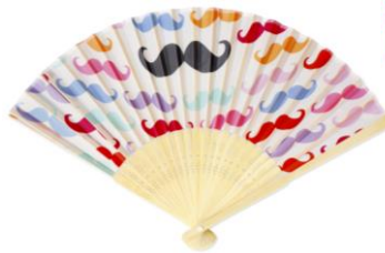
口元に黒いひげがくるよう に当ててみて！ 扇子 385円