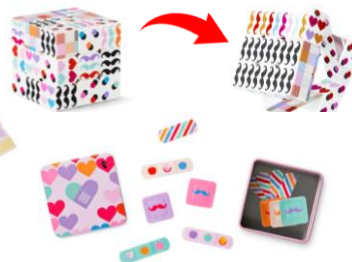
色んな柄のIQキューブは難易度高！ 人気の絆創膏もひげデザインで。