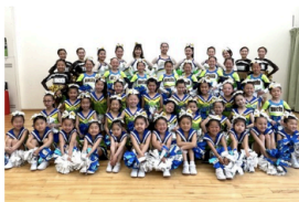
湘南ベルマーレチアダンススクール LUCIS