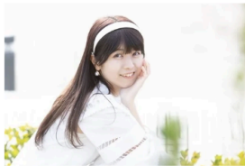
TikTokフォロワー40万人のインフルエンサー 難聴うさぎ