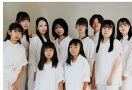
Japan's Got Talent セミファイナリスト UD DANCERS JAPAN