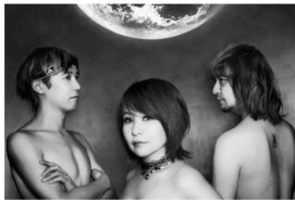
令和の虎をきっかけに親交の深いロックバンド IRabBits