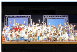
UD DANCE SCHOOL