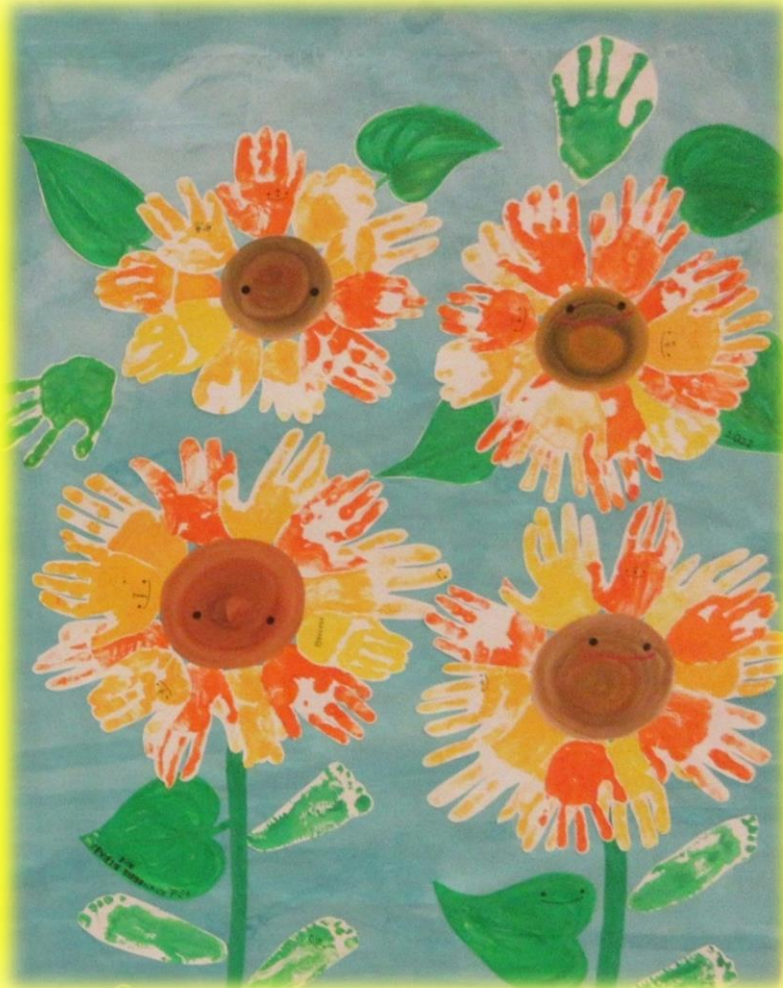
さくねん てんさくひん 昨年（しんねん）のアート展（てんさくひん）作品（さく）より