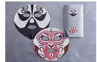
『京劇フェイスパック』