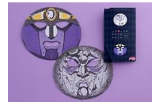
『ジョジョの奇妙な冒険フェイスパック』