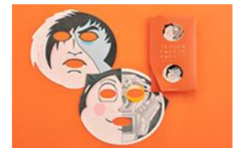
『手塚治虫ワールドフェイスパック』