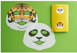
『動物 フェイスパック』