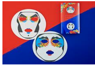
『ファッションフェイスパック』