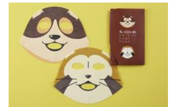
『友達フェイスパック』