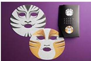
『キャッツ フェイスパック』