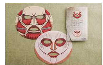
『進撃の巨人フェイスパック』