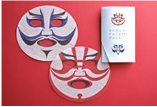
『歌舞伎 フェイスパック』