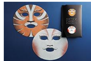
『キャッツ フェイスパック』