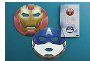
『マーベルフェイスパック』