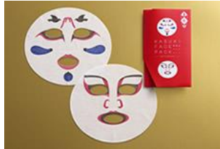
『歌舞伎 フェイスパック 寿』