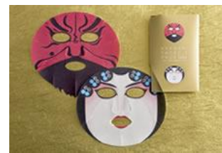
『京劇フェイスパック』