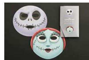
『ナイトメアー・ビフォア・クリスマス フェイスパック』