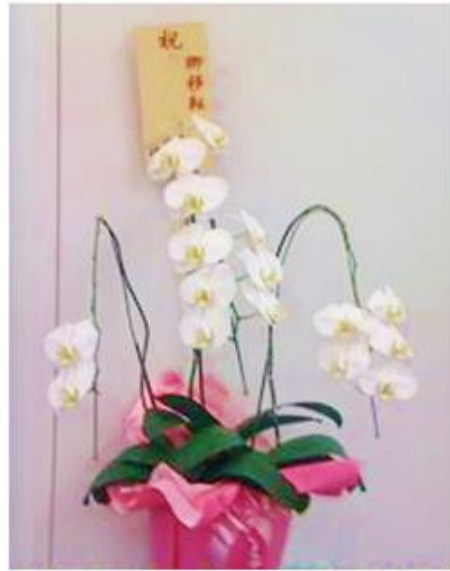
(お客様にお届けされた胡蝶蘭の1ヶ月後の比較写真。左：おむろ商品／右：一般生花店)