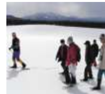
雪上トレッキング

※「体験型イベント」と「体験型ツアー」は、小岩井農場の農業・自然体験プログラムや食育プログラムを展開する「エコファーマーリングスクール」とベネッセの通信教育「進研ゼミ小学講座」のオプション教材である『クッキング★クラブ』・『かがく組』や、実験教室「ベネッセサイエンス教室」のコンテンツ・ノウハウを活かした内容としています。会場では、ベネッセの食育や科学に関する教材や教室の紹介も行います。