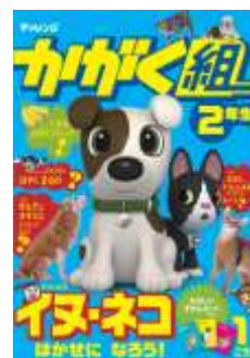
2012年4月開講 「かがく組2年生」

「かがく組」は、子どもの知的好奇心を育むのに最適な「小学2～4年生」という時期に、毎月1回、各学年の子どもにとって気になる科学テーマを楽しみながら体験できる講座です。2012年4月からは、これまでの「かがく組3・4年生」に加えて、小学2年生を対象とする新講座が開講します。小学2年生の子どもの発達に合わせて、子どもの「なんで?」「知りたい!」という知的好奇心を引き出し、多角的な視点で掘り下げていくことで、科学的思考力の素地を養います。