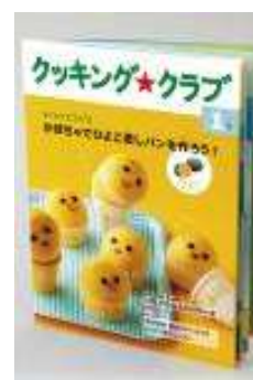
2012年4月開講 「クッキング★クラブ」

「クッキング★クラブ」は、小学3年生向けに2012年4月に新しく開講予定の、子どもが楽しく作れる料理をテーマにした食育・料理講座です。調理技術や食の知識を身につけながら、自分で計画して行動する自立心を育むことをねらいとし、12か月にわたって毎月季節に合った料理のテーマのテキストをお届けします。小学生の発達段階に合わせたレシピなので、輪切りやくし形切りなど包丁を用いた調理スキルをしっかり習得できるのはもちろん、食文化や食事の作法、片づけの仕方も写真を用いた詳しい解説で理解できます。