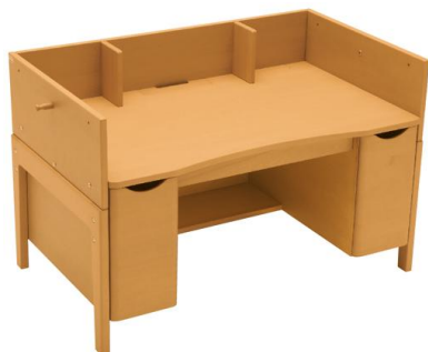
1)「 学びデスク まん巾タイプ 」