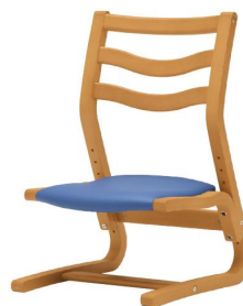
2)「 成長チェア ラダーバック 」