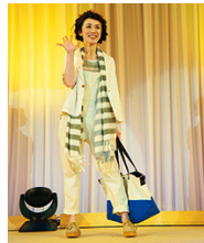
人気の読者主婦モデルが企業のアイテムをファッションショー風に紹介！