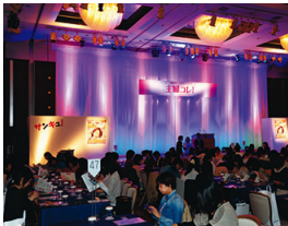
ロコミ主婦で賑わう会場 第3回は410名が参加！