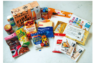
参加者へのお土産サンプル商品も大人気！