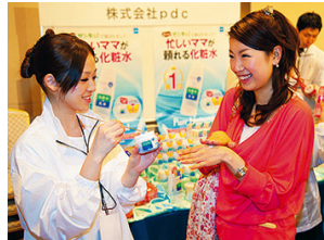
企業ブースではメーカー担当者と直接話をしながら商品が試せます