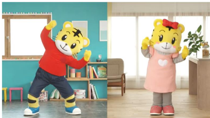
しまじろう音頭（振り付け指導版）