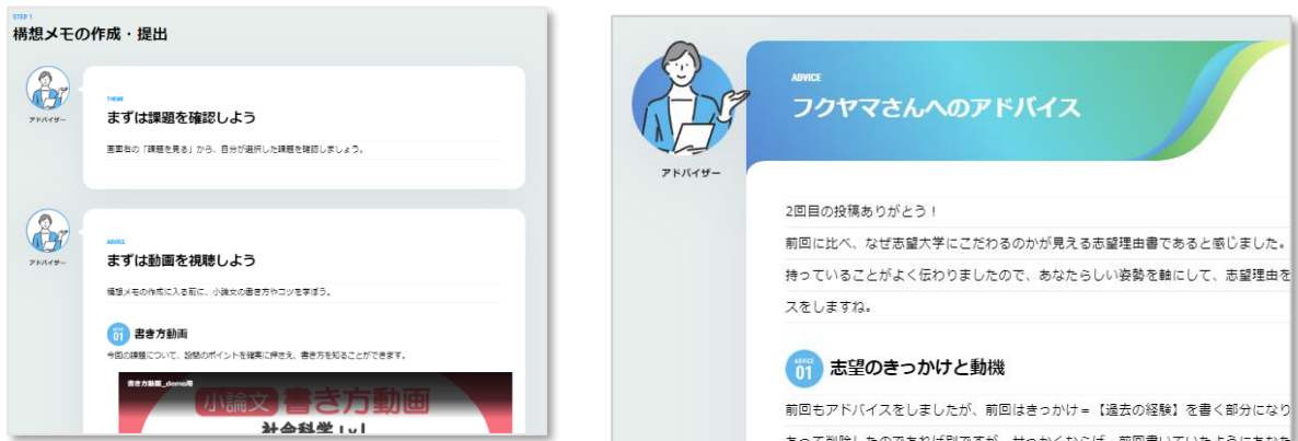
▲画像：左から小論文ネタ動画、構想メモ作成ナビ画面

「小論文・志望理由書ナビ」では、構想メモと文章の2段階のステップアップ添削を行います。構想メモへの添削アドバイスを踏まえながら文章を書くことで、よい小論文・志望理由書を書き上げる力が身につきます。