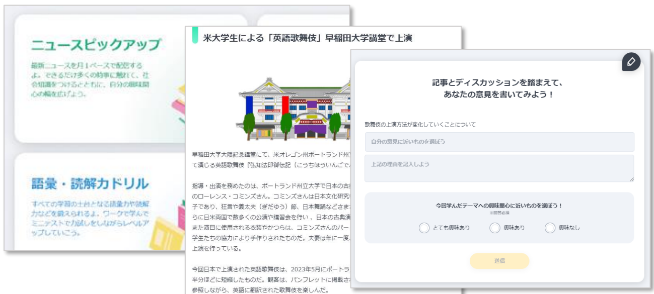
▲画像：左からトップ画面、教材の事例（素材、意見記述の画面）

「ニュースピックアップ」は最新のニュース記事とニュースに対する論点を題材にしなが、時事ネタや語彙などを調べるワークです。社会への関心を広げつつ、自分の立場を明確にしなが意見を述べる力を身につけます。朝学習や個別学習でも活用できます。