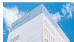
東京国際ビジネスカレッジ (福岡校)