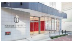
東京国際ビジネスカレッジ (東京)

北海道 宮城県 埼玉県 千葉県 東京都 神奈川県 愛知県 大阪府 岡山県 愛媛県 高知県 福岡県 鹿児島県