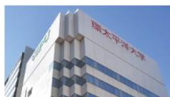
IPU・環太平洋大学 グローバルキャンパス (岡山駅前)