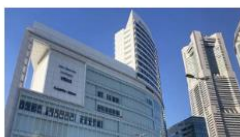
IPU・環太平洋大学 国際科学・教育研究所 (神奈川)