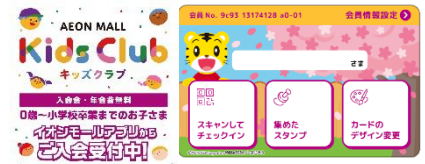
※券面データはイメージです

イオンモールキッズクラブについて： https://www.aeonmall.com/lp/kidsclub/