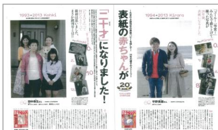
【創刊年の表紙ベビーを探せ！誌面イメージ】

CMのBGMはご自身もママになられたばかりのシンガーソングライター熊木杏里さんが歌う「一千一秒」。熊木杏里さんの曲が、ベネッセの女性向け会員制サイト「ウィメンズパーク」で人気だったことから、「ウィメンズパーク」内「子どもからプレゼントされたしあわせの瞬間を話そう」という投稿企画に、熊木杏里さんご自身も動画とメッセージで参加。そして皆さんの投稿メッセージからイメージを膨らませたオリジナルソングを制作する企画が同時に立ちあがっています。