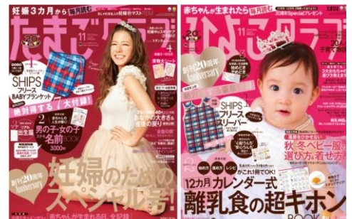
【「たまごクラブ」(上左)、「ひよこクラブ」(上右) 創刊号

20 年前に比べて、「妊娠中も自分らしく輝きたい」「積極的に育児ライフを楽しみたい」という「たまごクラブ」(下左)・「ひよこクラブ」(下右) 最新号】