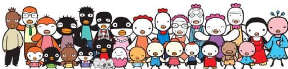
【多様な家族を象徴する「たまひよ」のキャラクター】

子育ての「大変」な局面ばかりが社会でフォーカスされる中、「赤ちゃんがふえる しあわせがふえる」をキーメッセージに、「たまひよ」は、様々な情報や商品サービスを通じて、あらためて「赤ちゃんが生まれ、育てていくことの幸せ」を伝え、応援していきます。