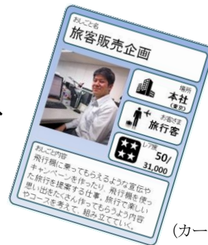
(カード画像はイメージです)

JAL 施設の見学などを行い、JALグループで働く人やモノを通じて、「働くということ」についての仕組みについて、カードラリー形式にて 楽しく学習をします。