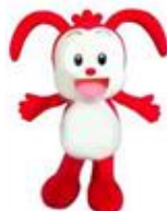
【進研ゼミ小学講座チャレンジタッチ (左)、講座キャラクター「コラショ」(右)】