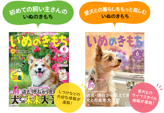
いぬのきもち 6 月号表紙