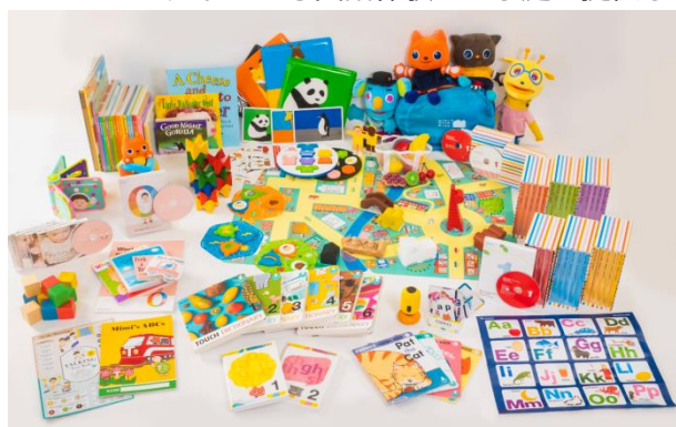
【0歳のお子さま向け】

2007年10月に開講した「Worldwide Kids」は今年で開講12年目を迎えます。「Worldwide Kids」は、英語力だけでなくコミュニケーション力も身につけることができる幼児向け英語教材で、0歳から始めて小学校入学まで6年間学習していただくことができます。同年代のネイティブのお子さまとコミュニケーションできる力を身につけます。教材は、発達心理学、異文化間教育学（グローバル教育）などを取り入れ、ベネッセが開発した英語教育プログラムにより構成されており、心や耳の柔軟な幼児期に、英語を話す力だけでなく「グローバル社会に羽ばたいていくために必要な知性と、コミュニケーションの土台となるオープンな心を育む」というコンセプトによる英語体験をご家庭に提供します。