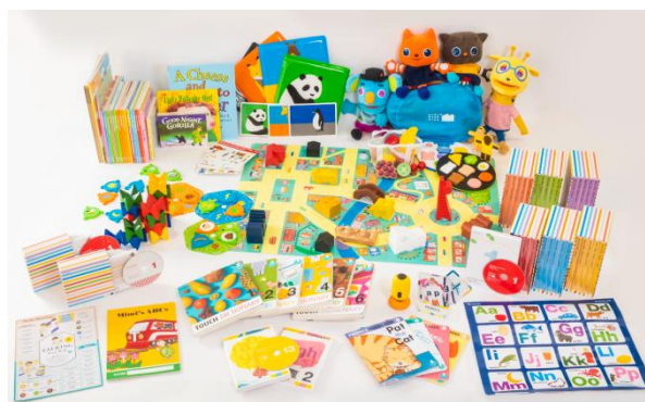
【1歳以上のお子さま向け】