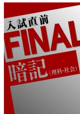
▲受験対策教材 (中3生・高3生向け)