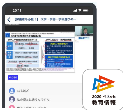
▲「ベネッセ 教育情報フォーラム」(アプリ)

また、「ベネッセ 教育情報フォーラム」の専用アプリでは、セミナー視聴や最新入試情報を受け取ることができ、中3・高3の学習を支援する「受験対策教材」の無償提供も行ってまいります。