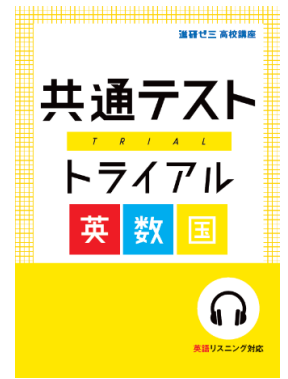
▲受験対策教材 (中3生・高3生向け)

「ベネッセ 教育情報フォーラム」の新規サービス開始の背景には、中3生515世帯・高3生515世帯の計1030世帯を対象に8月に実施した「コロナ禍における受験生影響調査」があり、そこで明らかになった受験生が抱える困り・悩みに対し、解決の糸口になるようなサービス・アプリの設計を行いました。