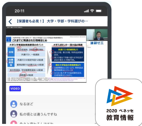
▲「ベネッセ 教育情報フォーラム」(アプリ)

また、「ベネッセ 教育情報フォーラム」の専用アプリでは、セミナー視聴や最新入試情報を受け取ることができ、中3・高3の学習を支援する「受験対策教材」の無償提供も行ってまいります。