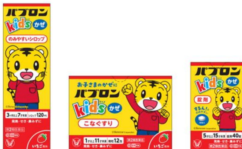
パブロンキッズかぜシロップ パブロンキッズかぜ微粒 パブロンキッズかぜ錠 【第2類医薬品】 かぜ諸症状（発熱、せき、鼻みず）の緩和

この悩みに少しでも寄り添えるように、「パブロンキッズかぜシリーズ」と「こどもちゃれんじ」は「しまじろう」のコラボパッケージ発売を決定し、2023年8月にしまじろうをパッケージデザインとした「パブロンキッズかぜシロップ」「パブロンキッズかぜ微粒」「パブロンキッズかぜ錠」を発売しました。