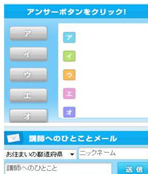
<受講生はアンサーボタンで回答できる>