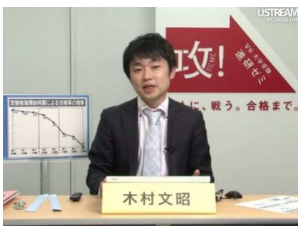
<講師によるライブ授業風景>

ベネッセでは、より効果的な教育サービスを提供するため、今後もデジタルを活用したサービスを積極的に展開していきます。そして従来の「通信教育」「塾」といった枠を超えて、子どもたちの一人ひとりの状況により合った教育サービスを提供することを目指してまいります。