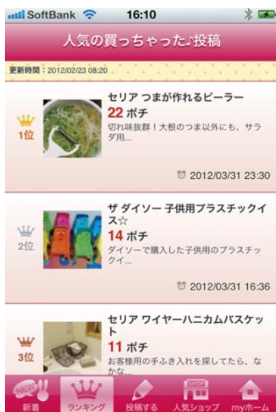
<スマホアプリランキングイメージ>