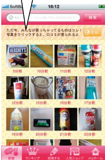
<スマホアプリイメージ>