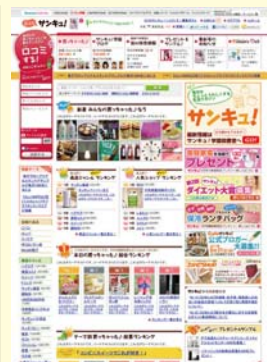
<パソコントップページ>