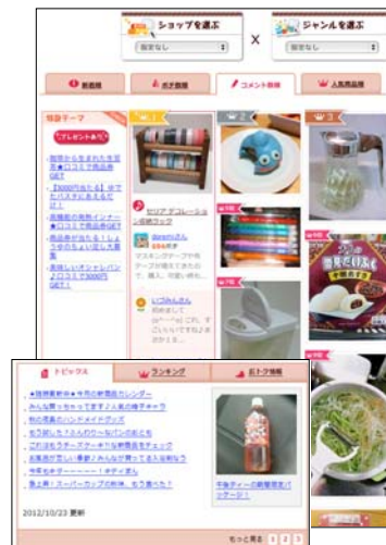
人気ブロガーによる最新ランキング情報

2007年、生活情報誌『サンキュ!』の読者からよせられる「もっと多くの主婦のリアルボイスを知りたい!」という声に応じてスタート。現在、月間ユニークユーザー数が90万人を超える(2012年9月)人気サイト。カリスマ主婦のブログコーナーのほか、誰でも買ったものの感想を投稿できる「買ったかった♪」コーナーでは、毎日の生活に必要な食品や日用品などのレビューを28万件以上掲載中。主婦目線で選ばれた商品の単なる感想のみにとどまらず、自分なりの使い方やアレンジ方法まで詳しく紹介されている点がほかにはない特徴。写真クオリティの高さも人気ブロガーが集う『ロコミサンキュ!』ならではの。また、毎日1200件ほどの投稿を編集部がチェックし、最新のトピックスやランキング情報として投稿を編集してまとめているのも特長。