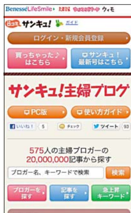
スマホ用トップページ

571人の「サンキュ! 主婦ブロガー」でなくても、自分のブログに書いた記事を『サンキュ! 主婦ブログ』に投稿できる『サンキュ! サポーターブロガー』制度が誕生しました。ロコミサンキュ! に会員登録(無料)して自分のブログを登録するだけの簡単手続き。2012年10月30日~11月30日にサポーターブロガーとして登録をすると、500ポイント単位で図書カードと交換できるロコミサンキュ! ポイントを50ポイントをプレゼントします。