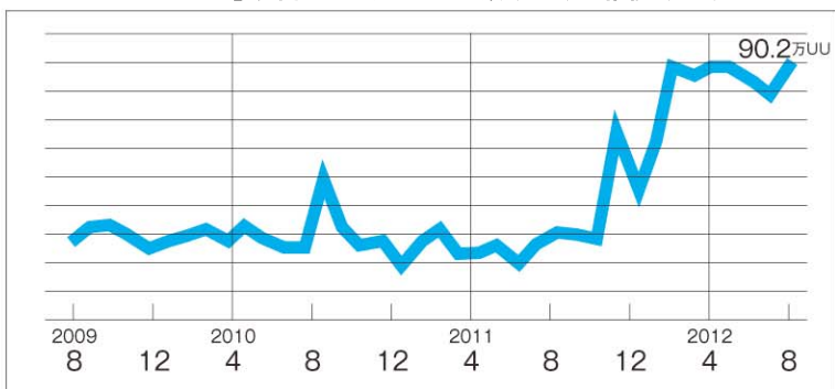
■「ロコミサンキュ!」月間ユニークユーザー数(UU)の推移(図2)

現在4割以上の主婦ブロガー(同サイト公式ブロガー)がスマホユーザー。2011年12月に行われた同調査では、わずかスマホ所持率は17%だった。(2012.8現在)