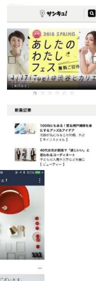
サンキュ！LINE ニュース