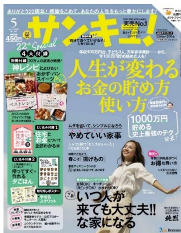
「サンキュ！」 月刊誌 毎月 2 日全国発売