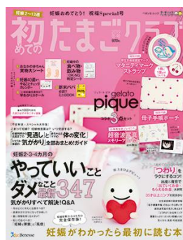
初めてのたまごクラブ 2018 冬号