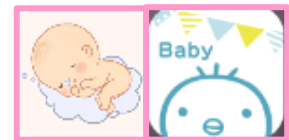
アプリ「まいにちのたまごクラブ」 「まいにちのひよこクラブ」