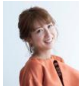
<ママ部門> 辻希美さん