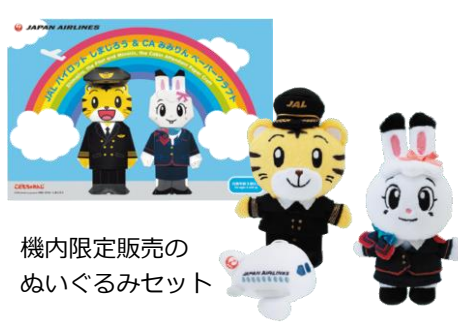
機内限定販売の ぬいぐるみセット