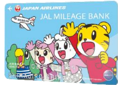
12歳以下のお子さま限定デザイン JALマイレージバンク「しまじろうカード」

ベネッセはJALとともに、これからも子どもたちが、安心・安全な楽しい旅を楽しみながら、豊かに成長していけるよう、様々な取り組みにチャレンジしてまいります。