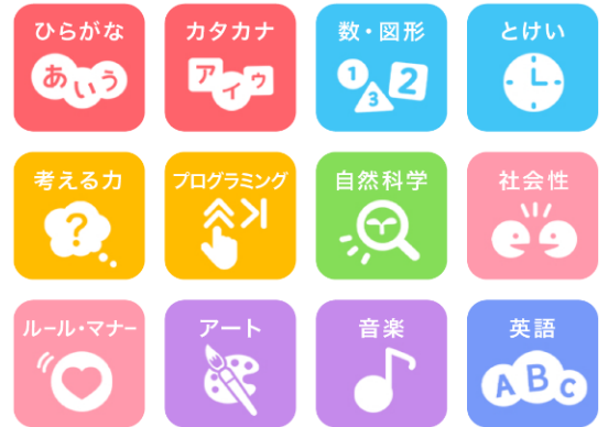
プログラミングの学習コンテンツ例

小学校で必修のプログラミング学習にも、宝探しなどの設定で楽しく取り組みます。また、音楽やアートなど、音声や動画の特長を活かしたデジタル学習ならではのコンテンツで、体験を通して想像力を育みます。