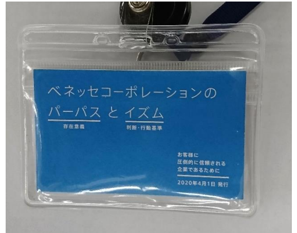
事例：社員が携帯する、パーパスとイズムのカード 10の行動基準の一つに、「安心・安全の提供」を掲げています。

これを実現すべく同社では製品安全を統括する「商品・サービス安全管理部」を組織し、各種規定の制定や各工程における安全審査の運営、事故発生時の対応判断など、全社の横串組織として各事業部門に対応する体制を構築している。また、各事業部には、事業部内における製品安全活動の推進役として「安全管理担当責任者」を置き、商品・サービス安全管理部と各事業部が適度な緊張関係の下、共同で安全を管理する「製品安全管理体制」を構築している。