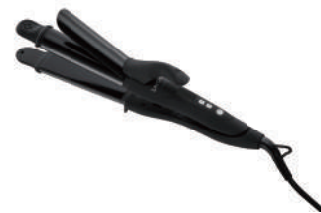
32mm 2,980 円 ( 税別 )