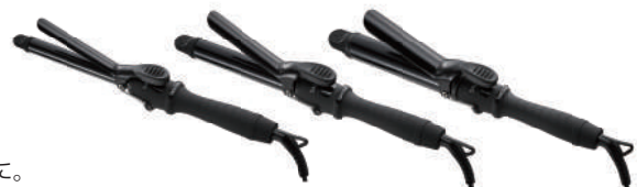
19mm / 25mm / 32mm 各 2,980 円 ( 税別 )