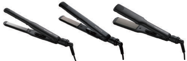
15mm / 24mm / 35mm 各 2,980 円 ( 税別 )