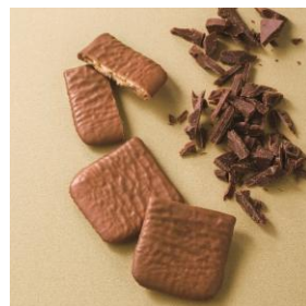
ビエ オウ ショコラオレ

この時期はショコラをまとった秋冬限定の定番ラインナップが登場！「ポーム ド テール※」は数ヶ月洋酒に漬け込んだフルーツを使ったフルーツケーキとバタークリームを、マジパンとミルクチョコレートで包んだお菓子。「バトー ドゥ マカダミア」はナッツのゴロっとした食感と、チョコレートの上品な甘さで、もう1枚、また1枚と食べたくなるおいしさです。「プラン リュンヌ」はフランス語で“満月”の意味。ほろっとした食感と、くちどけのよいチョコレートのバランスをお楽しみいただけます。「ビエ オウ ショコラオレ」はラングドシャー生地をふたつ折りにして、ミルクチョコレートでやさしく包んだクッキーです。贈り物にも、自分へのごほうびにも。この季節にお楽しみいただきたい、多彩なラインナップをご用意しました。