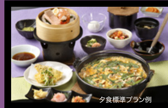
夕食標準プラン例