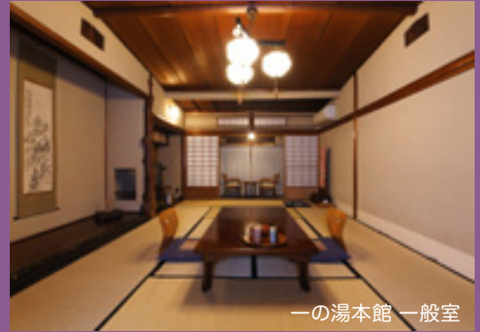
一の湯本館 一般室