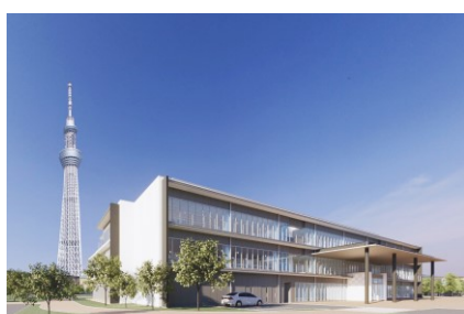
本校舎・墨田キャンパス完成イメージ (2019年12月末完成)

学校法人電子学園（東京都新宿区、理事長 多忠貴、以下「電子学園」）が新たに設置に向けて進めていた情報経営イノベーション専門職大学は、2019年11月1日に文部科学省 大学設置・学校法人審議会より認可の答申が成され、2019年11月11日付で文部科学大臣より正式に設置が認可されました。これにより、2020年4月1日の開学が正式に決定いたしました。つきましては、2019年11月13日（水）午前10時より大学公式Webサイトにて出願の受付を開始いたしますことをお知らせいたします。