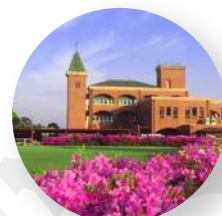
セブンミリオンカントリークラブ - 福岡県福岡市 -