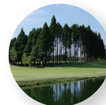
千葉バーディークラブ - 千葉県八街市 -