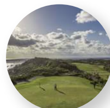
オーシャンリンクス宮古島 - 沖縄県宮古島 -