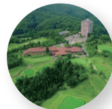
G-styleカントリー倶楽部 - 兵庫県佐用郡 -