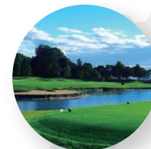
GRAND PGM サンヒルズカントリークラブ - 栃木県宇都宮市 -