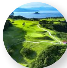
川奈ホテルゴルフコース - 静岡県伊東市 -