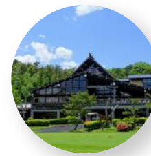
白河高原カントリークラブ - 福島県西白河郡 -