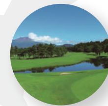
軽井沢72ゴルフ - 長野県軽井沢 -