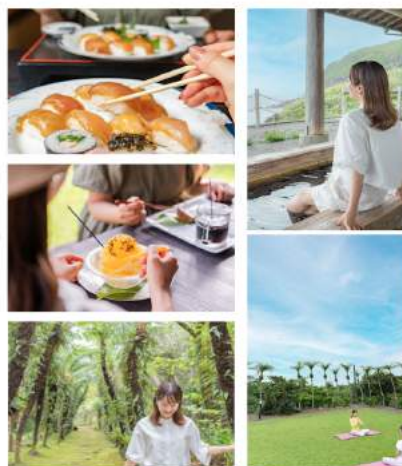
<当社による八丈島のイメージ転換例>