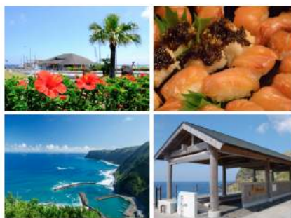
<これまでの八丈島のイメージ例>

インスタ世代とも言われるミレニアル世代は、写真による視覚的な情報収集を得意としています。そんなミレニアル世代に“自分事化”し、“共感”してもらう事を主な目的に、写真を通じたビジュアルイメージの転換を行っています。