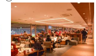
⑦