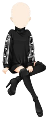
ラインスリーブタートルコーデ

内容：『ガルシヨ☆』×『ANAP』のコラボガチャが期間限定で登場。この機会ではか入手できない限定アイテムです。詳細はアプリ内のキャンペーンページをご覧ください。