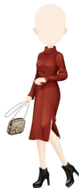
リブハイネックコーデ